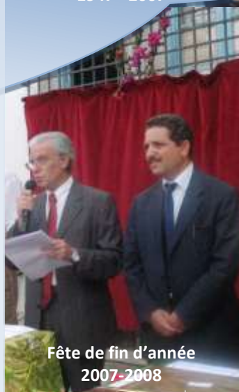
Fête de fin d'année 2007-2008