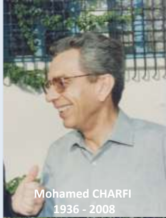
Mohamed CHARFI 1936 - 2008

La faculté est habilitée à dispenser les formations suivantes :